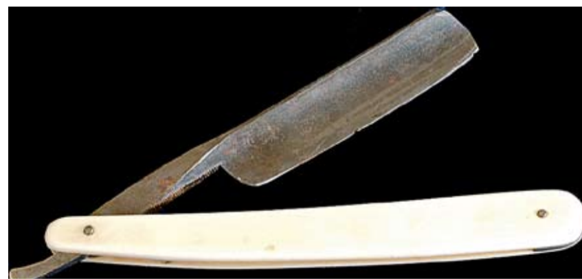
Rakkniven som Lord Carnarvon skar sig med.

Fast det ena behöver ju inte utesluta det andra. Highclere Castle är en höj-dare, inte minst geografiskt – utsikten från slottet är precis så där engelsk som vi svenskar vill ha den. Så gå in på hemsidan www.highclerecastle.co.uk och njut. Exteriör och interiör är en smaksak, men ingen kan undvika att fascinerar. ■