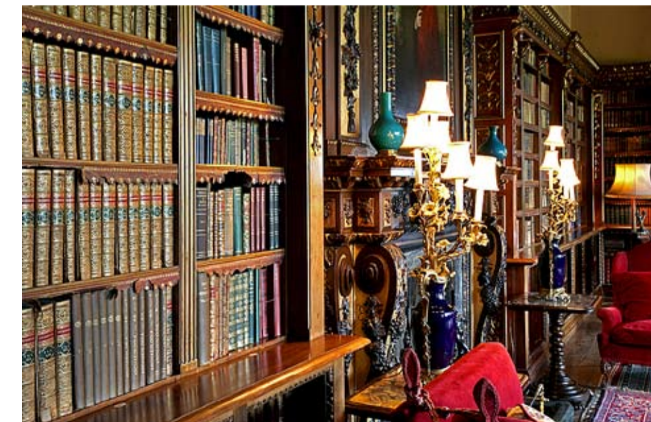
Den fjärde earlen av Highclere Castle kunde sina klassiska språk. I slottets bibliotek står ett antal böcker författade av honom själv, essäer, historia, föredrag etc.