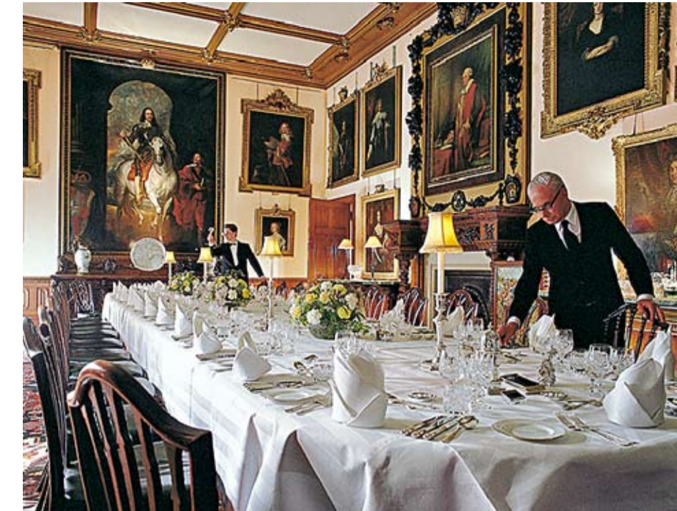
Dukat för middag på slottet.