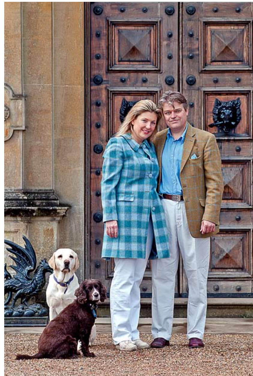
Lady och Lord Carnarvon, de åttonde i ordningen, har skapat en permanent egyptisk utställning i slottets källare.