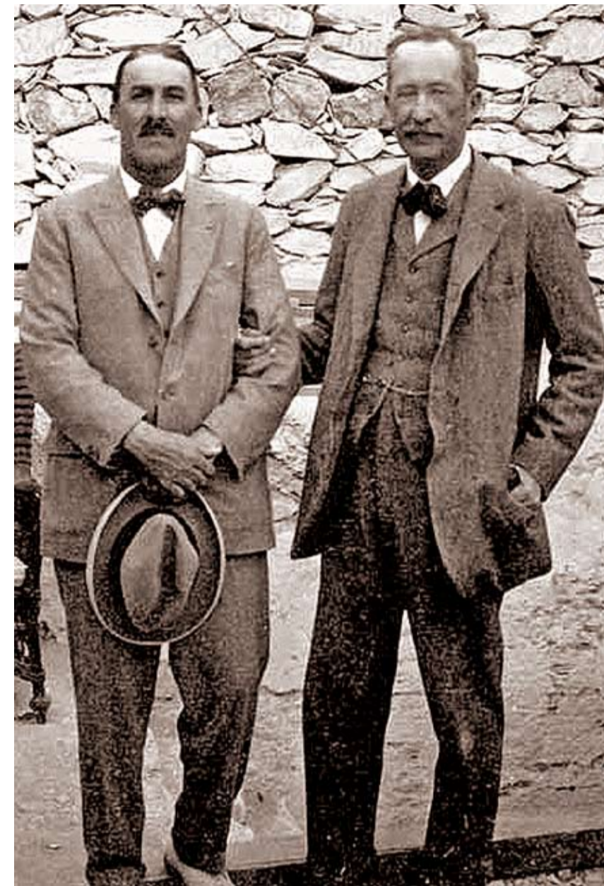
Lord Carnarvon och hans kompanjon Howard Carter. De två herrarna arbetade tillsammans i 16 år.