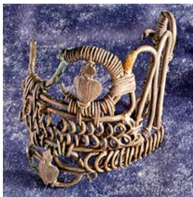
Två av föremålen i den egyptiska samlingen på Highclere Castle.

Till en början arbetade han ensam men insåg snart att han behövde en kompanjon. En sådan fann han i Howard Carter, arbetslös konstnär, tillika egyptolog. De två herrarna blev snart goda vänner och kom att arbeta tillsammans i 16 år. Lord Carnarvon som hade de nödvändiga ekonomiska resurserna byggde ett hus åt Carter på vägen till Konungarnas dal – i folkmun kallat Castle Carter – och såg