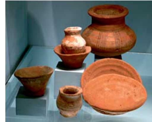
Fler föremål ur den egyptiska samlingen på Highclere Castle.